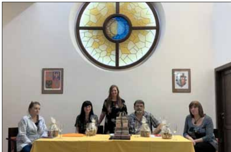
Autorské čtení a beseda.