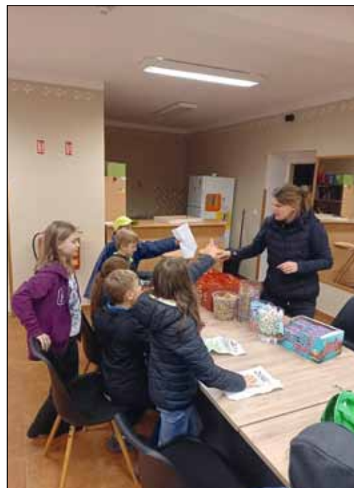
Po stopách Roalda Dahla.