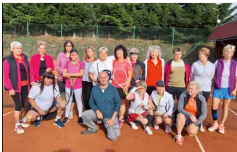
Memoriál Jindřišky Mitošinkové.