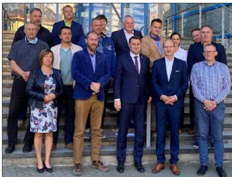
Jednání starostů ze Šluknovska.