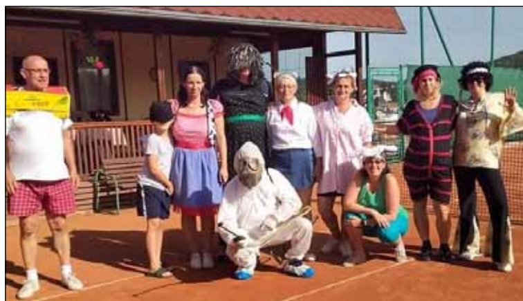
Legrando grando mač.