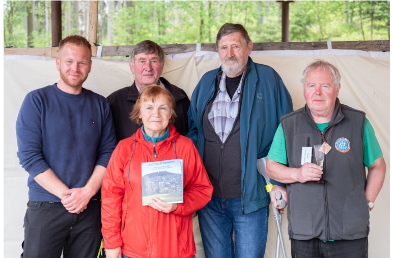
Křest knihy Poustevnické vandrování.