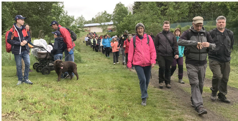
Příchod na start.