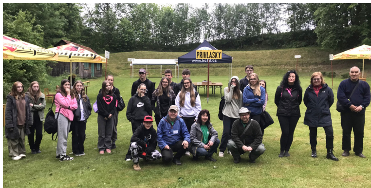
Nástup kontrol.